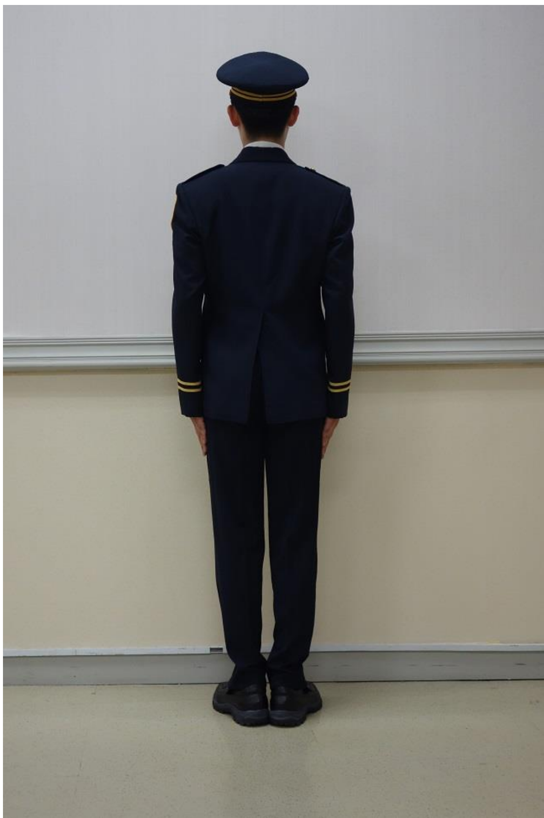
移民署男性常服（背面）