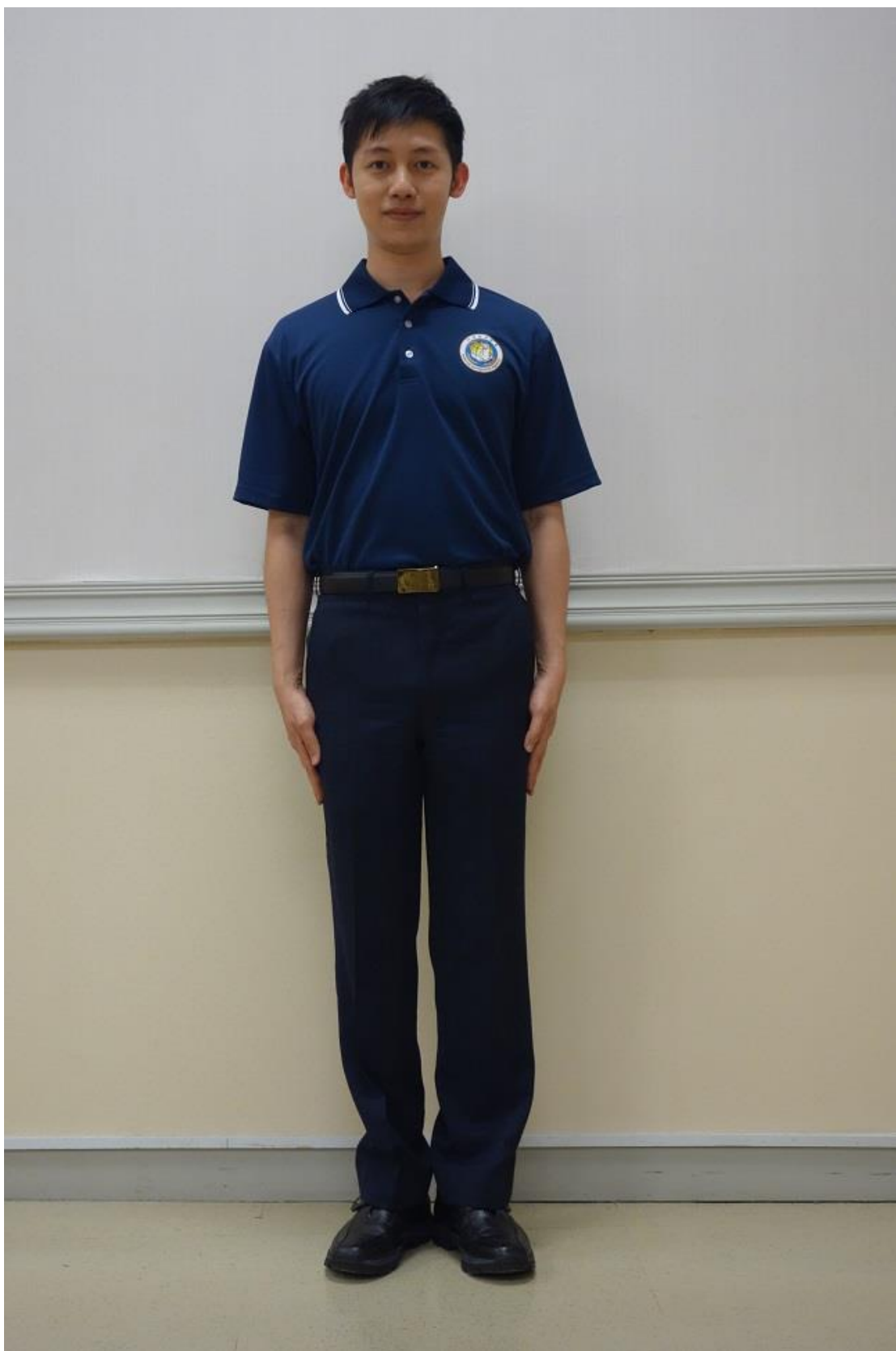
移民署夏季勤務工作服-有領式運動衫(正面)