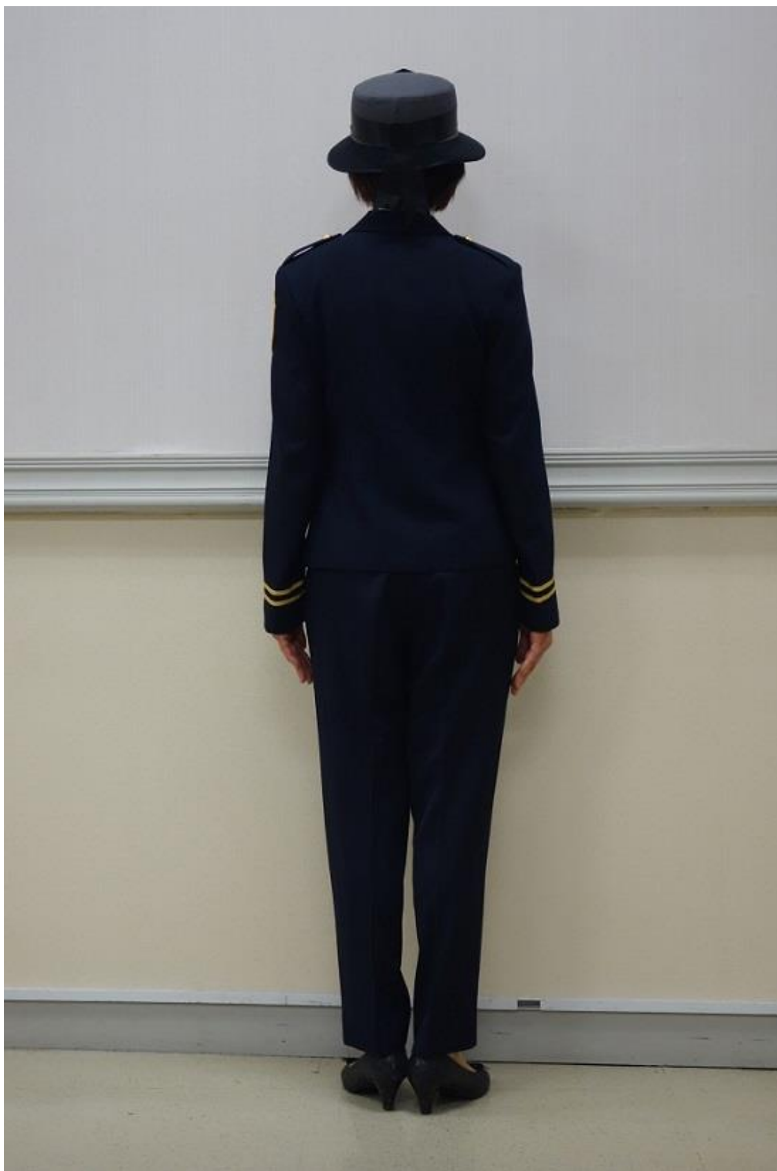
移民署女性常服（背面）