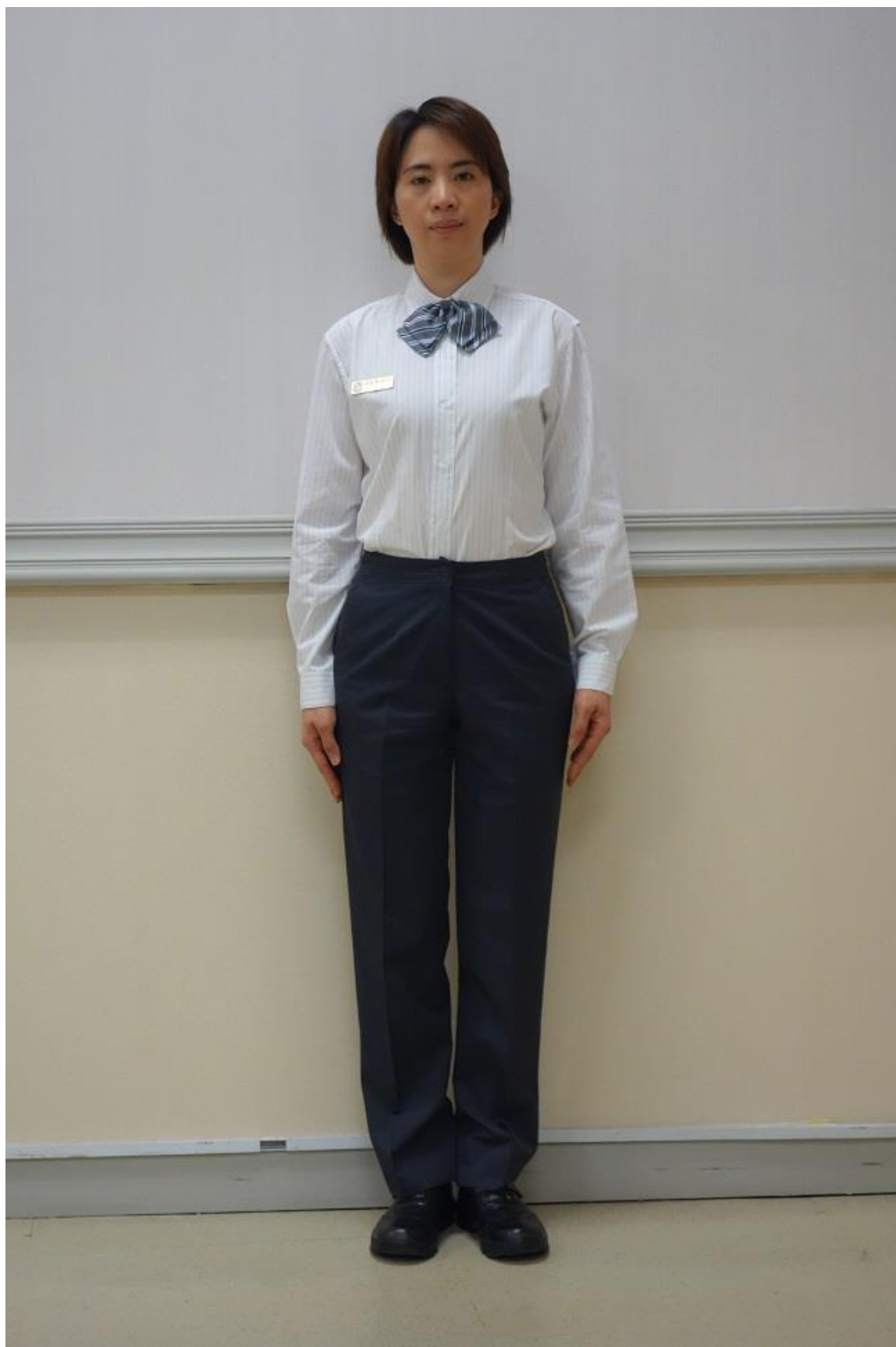
移民署女性冬季便服-襯衫(正面)