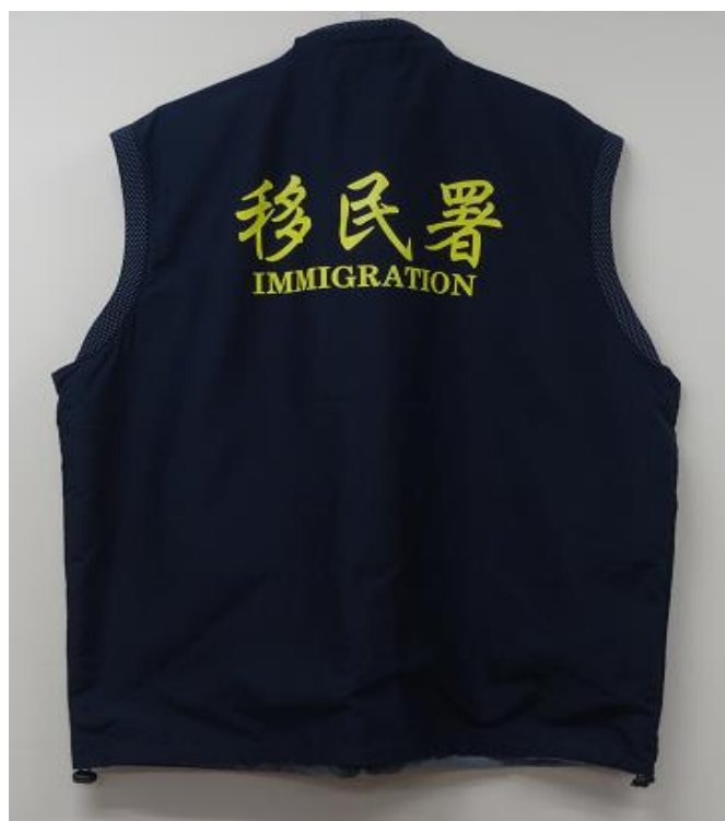
移民署-勤務背心 (背面)