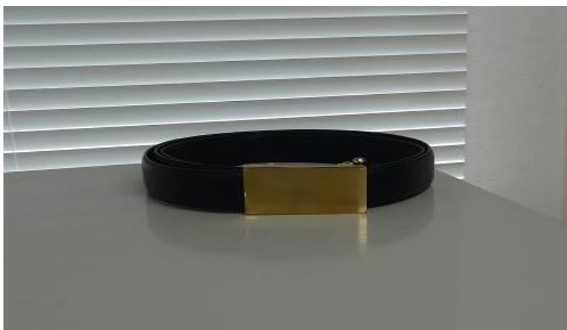
移民署男性常服-褲帶