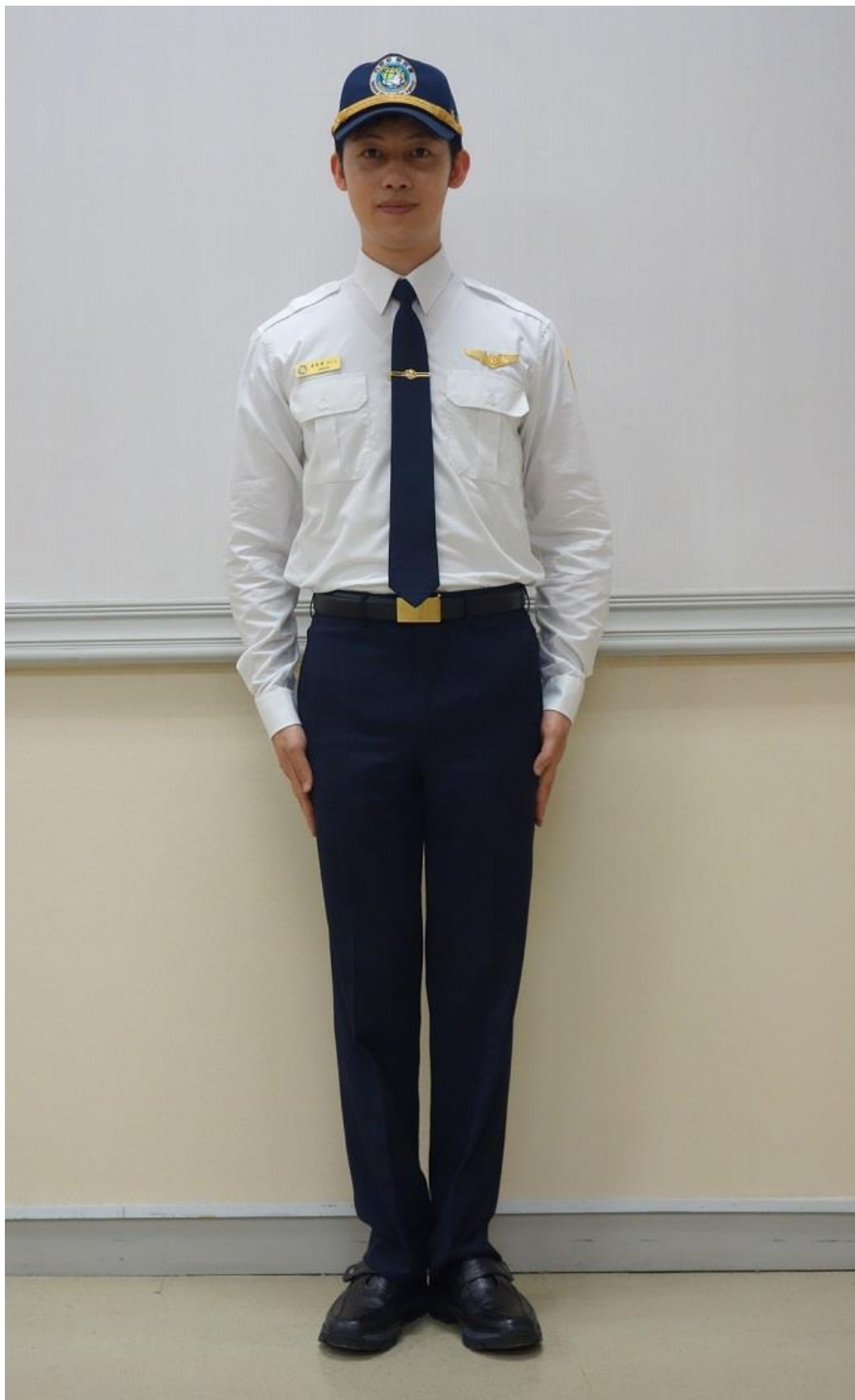
移民署男性冬季常服-襯衫（正面）