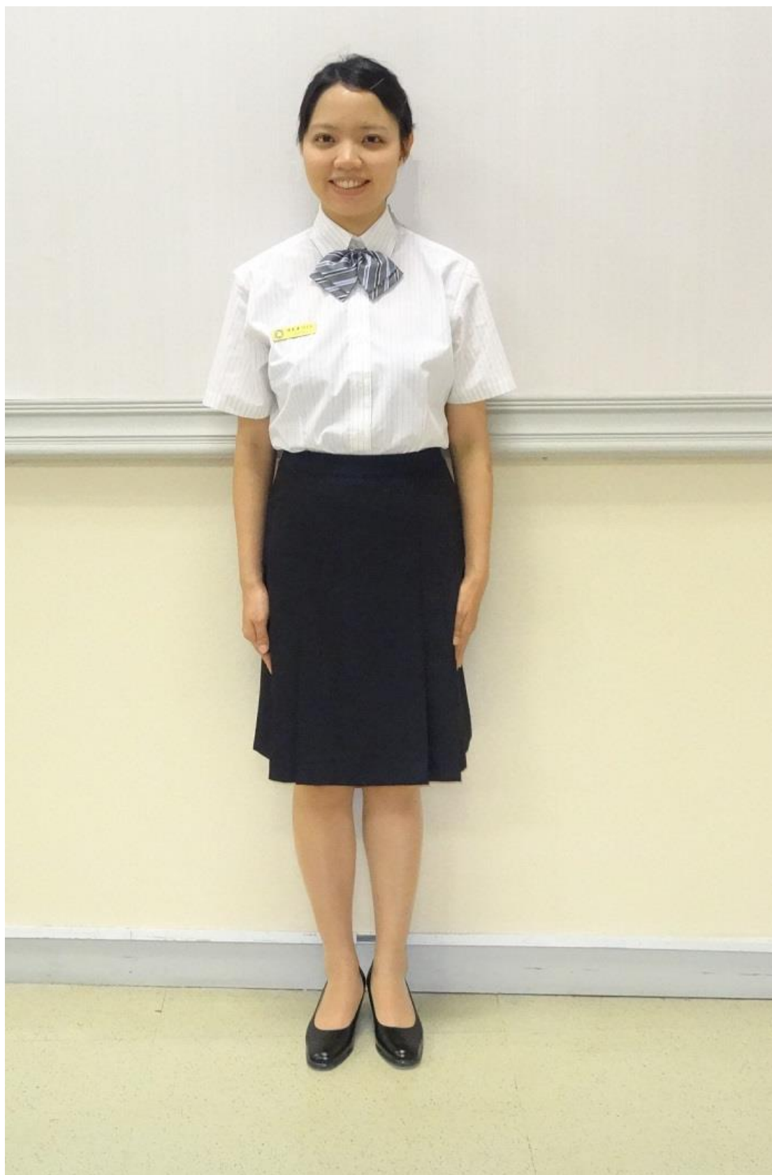
移民署女性夏季便服-裙裝(正面)