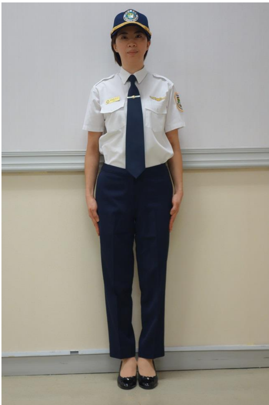
移民署女性夏季常服-襯衫（正面）