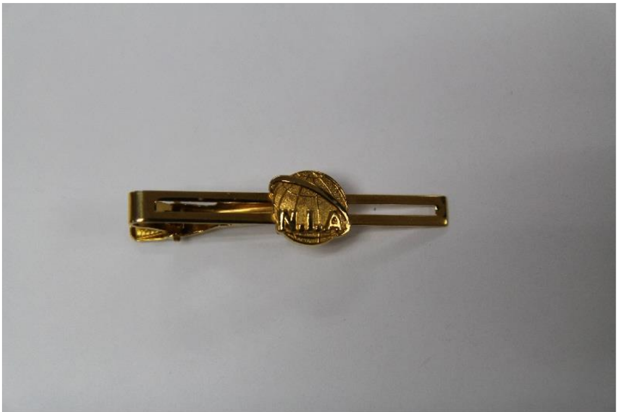
移民署男性常服-領帶夾