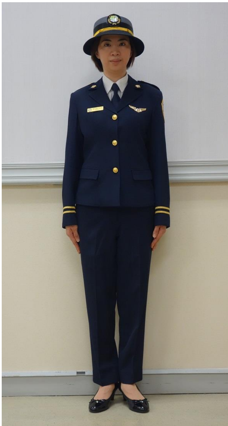
移民署女性常服（正面）