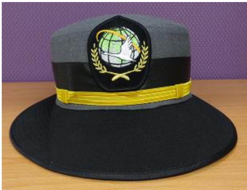
移民署女性常服-大盤帽