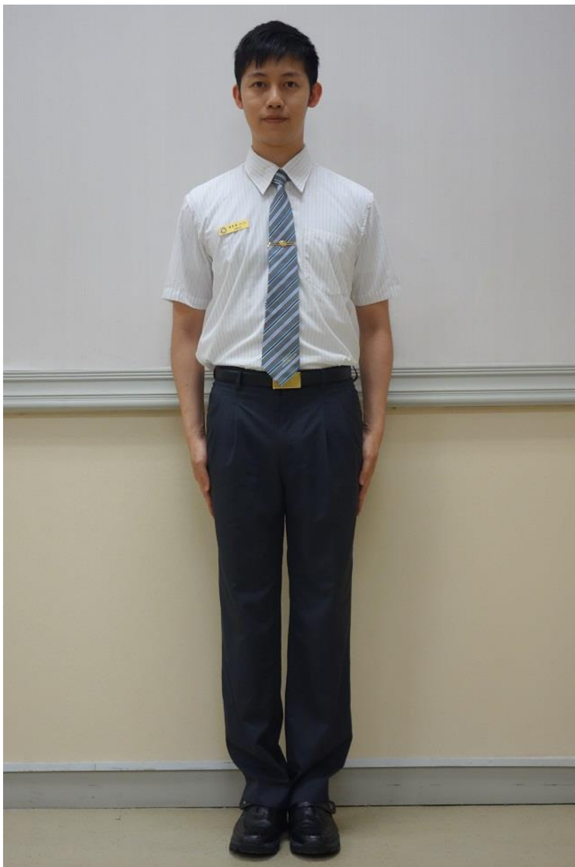
移民署男性夏季便服-襯衫(正面)