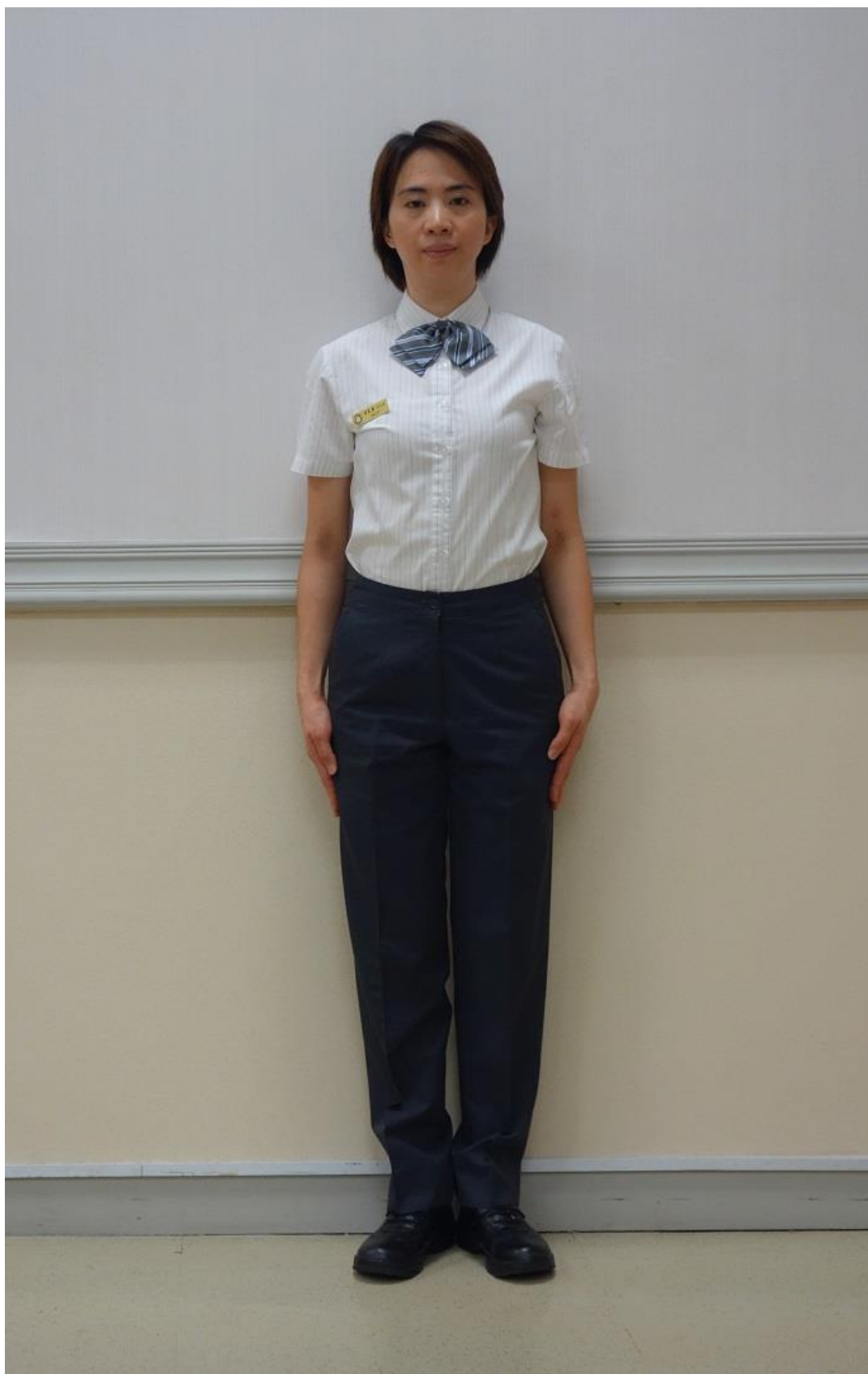
移民署女性夏季便服-襯衫(正面)