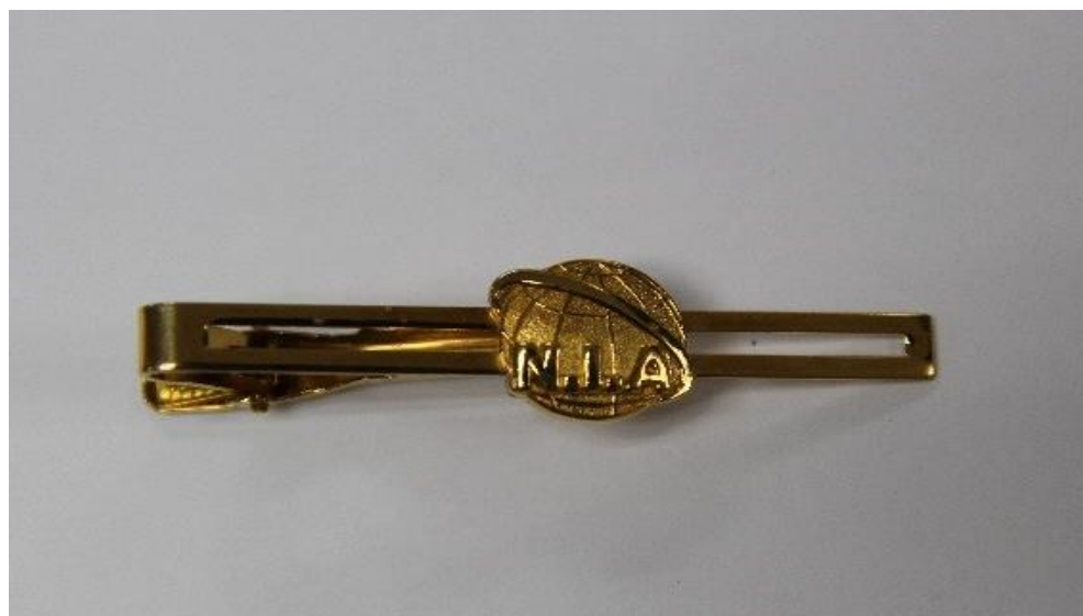
移民署男性便服-領帶夾