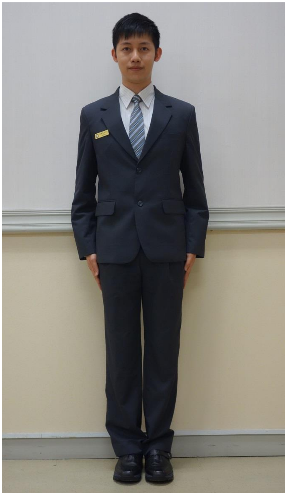
移民署男性便服(正面)