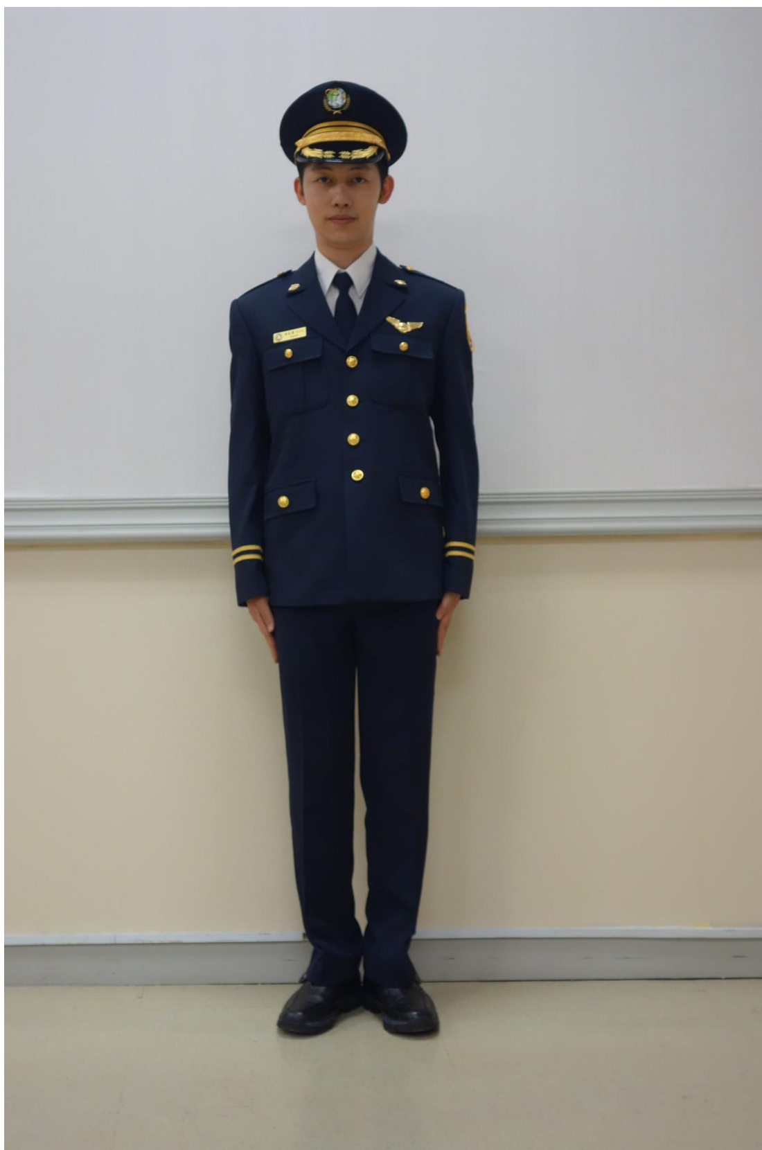
移民署男性常服(正面)