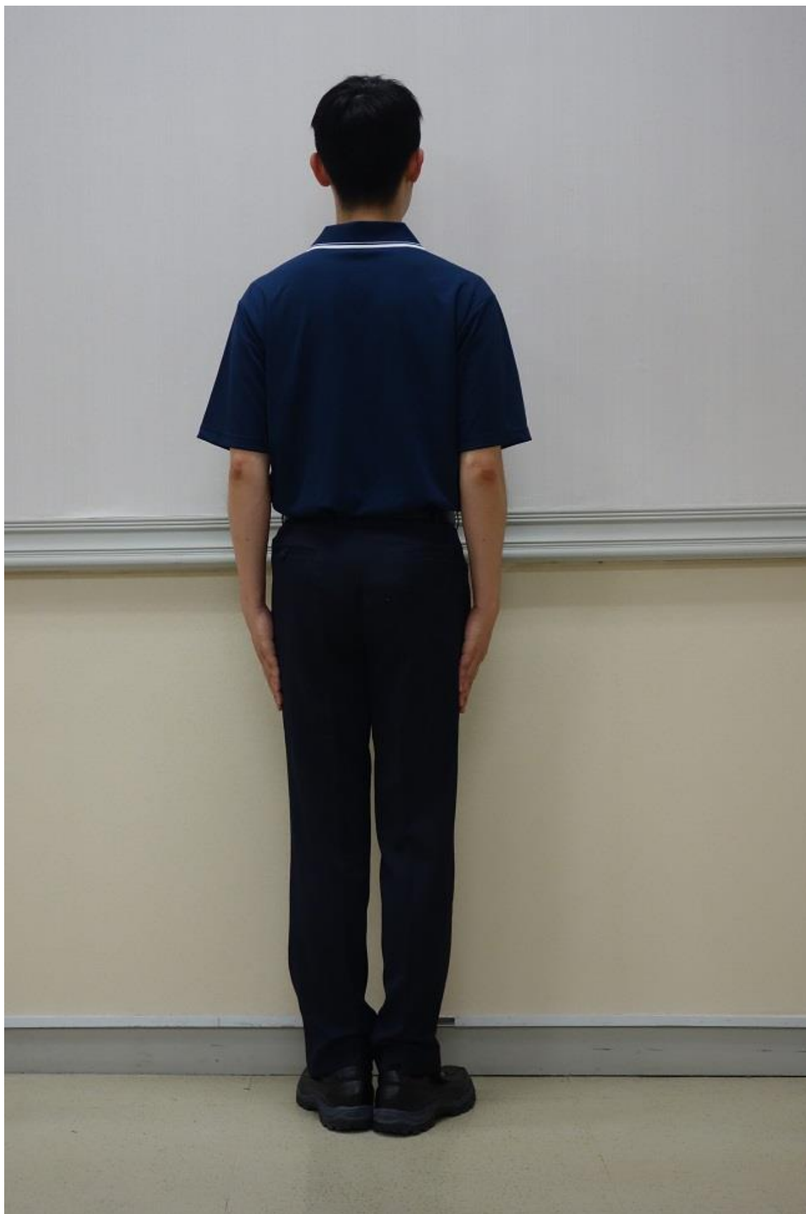
移民署夏季勤務工作服-有領式運動衫(背面)