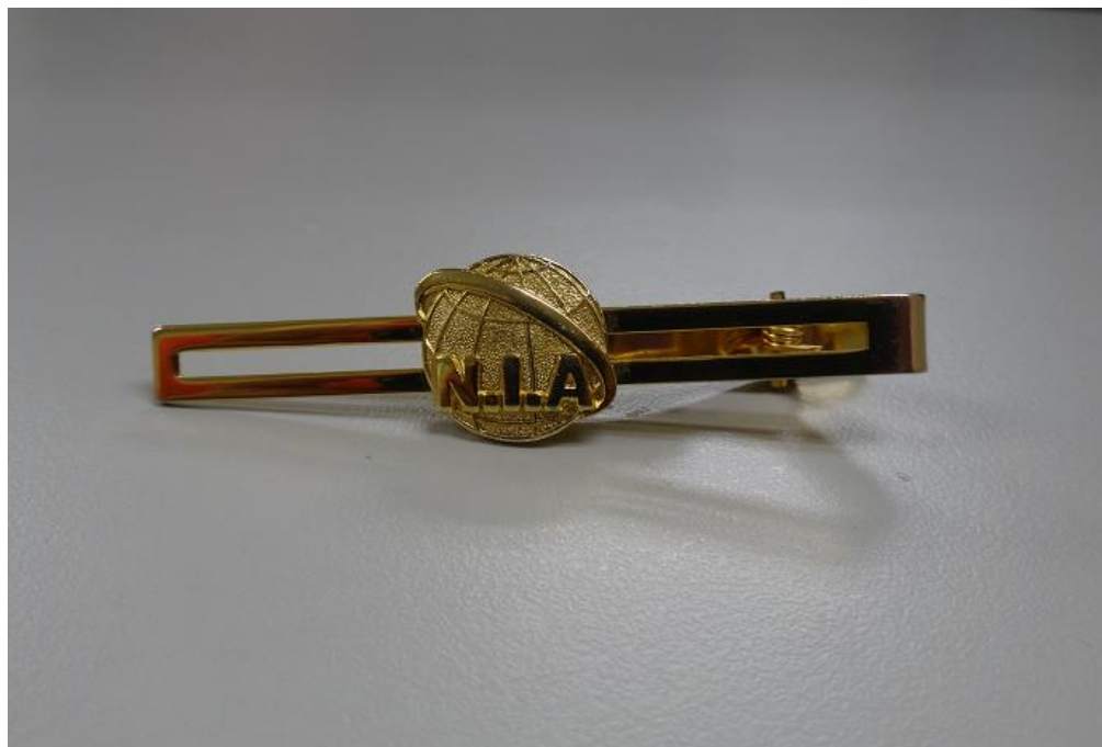
移民署女性常服-領帶夾