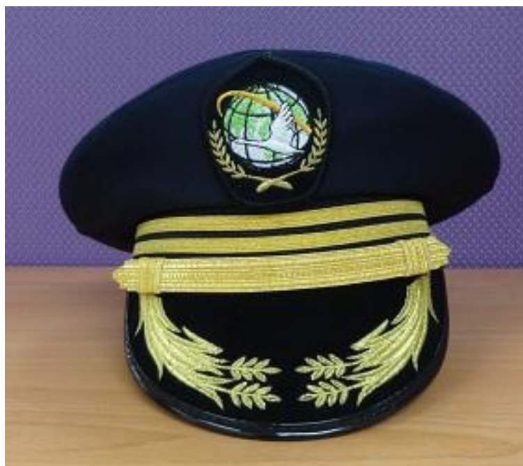
移民署男性常服-大盤帽