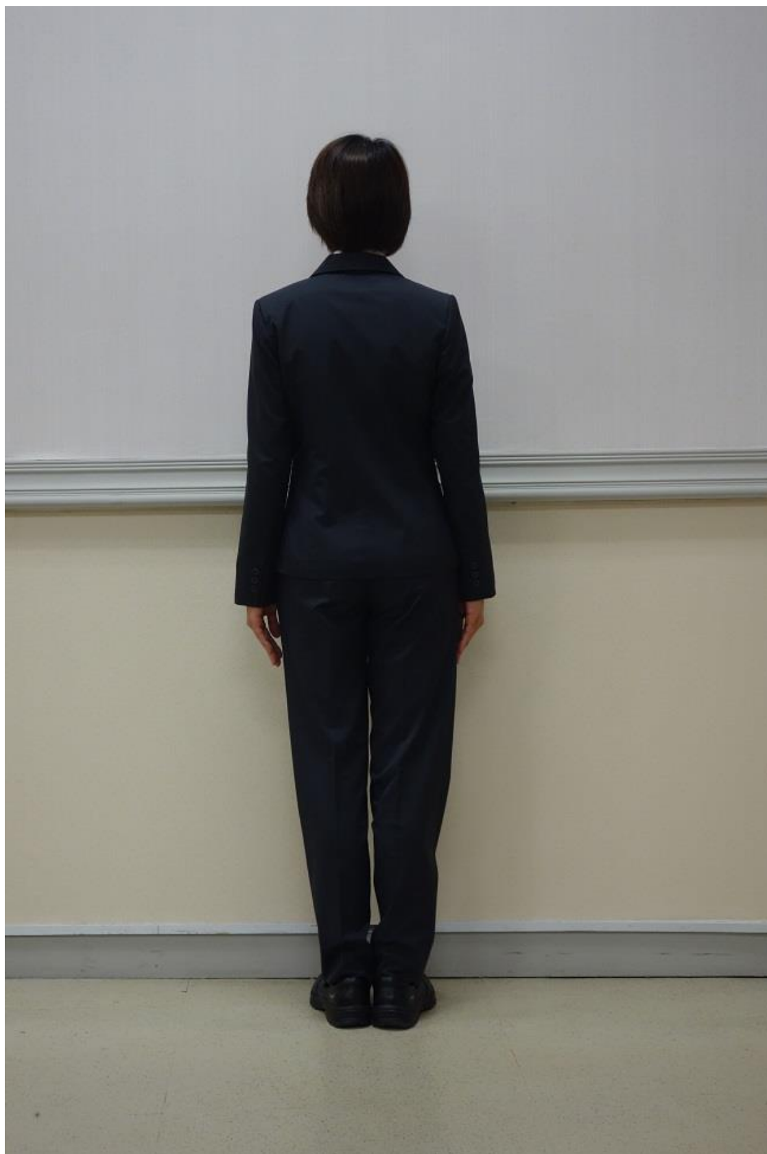
移民署女性便服(背面)