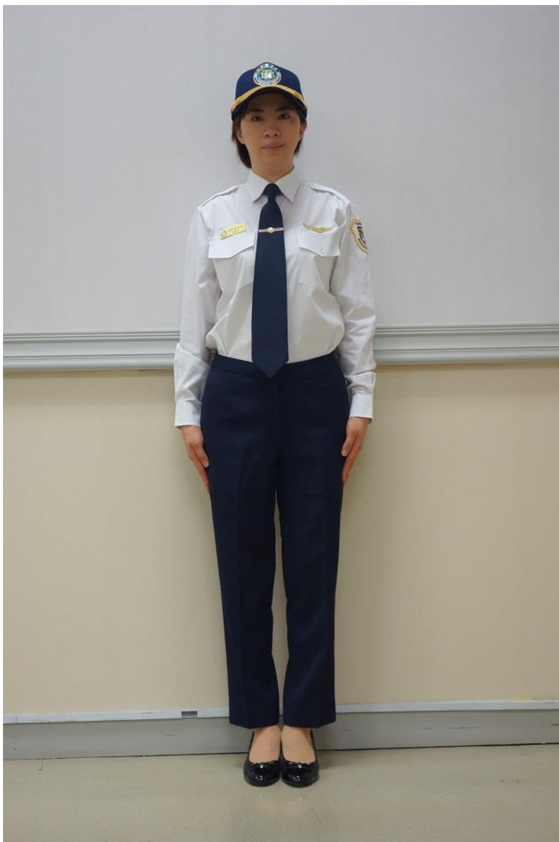
移民署女性冬季常服-襯衫（正面）