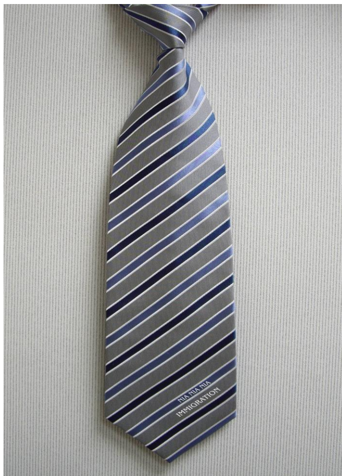
移民署男性西服-領帶