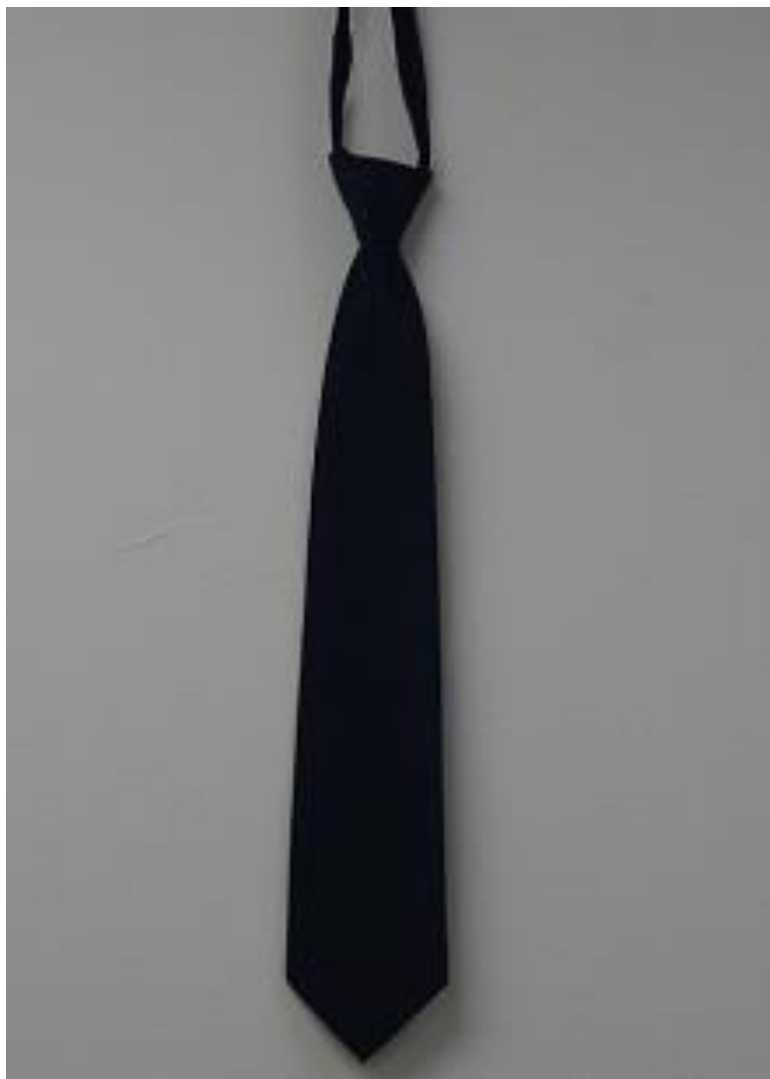
移民署男性常服-領帶