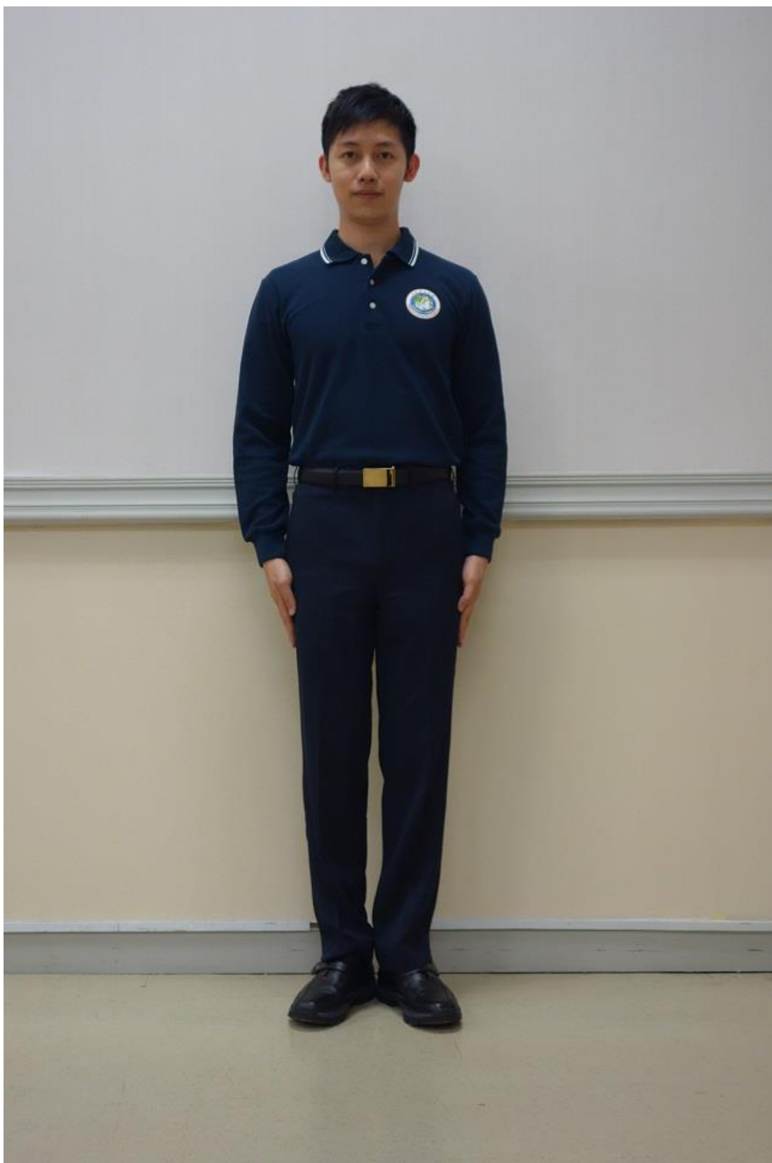
移民署冬季勤務工作服-有領式運動衫(正面)