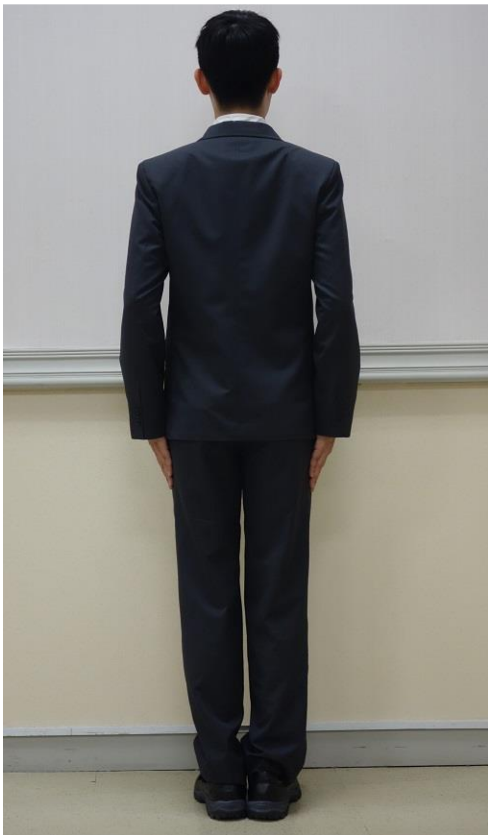
移民署男性便服（背面）