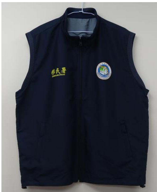
移民署-勤務背心(正面)