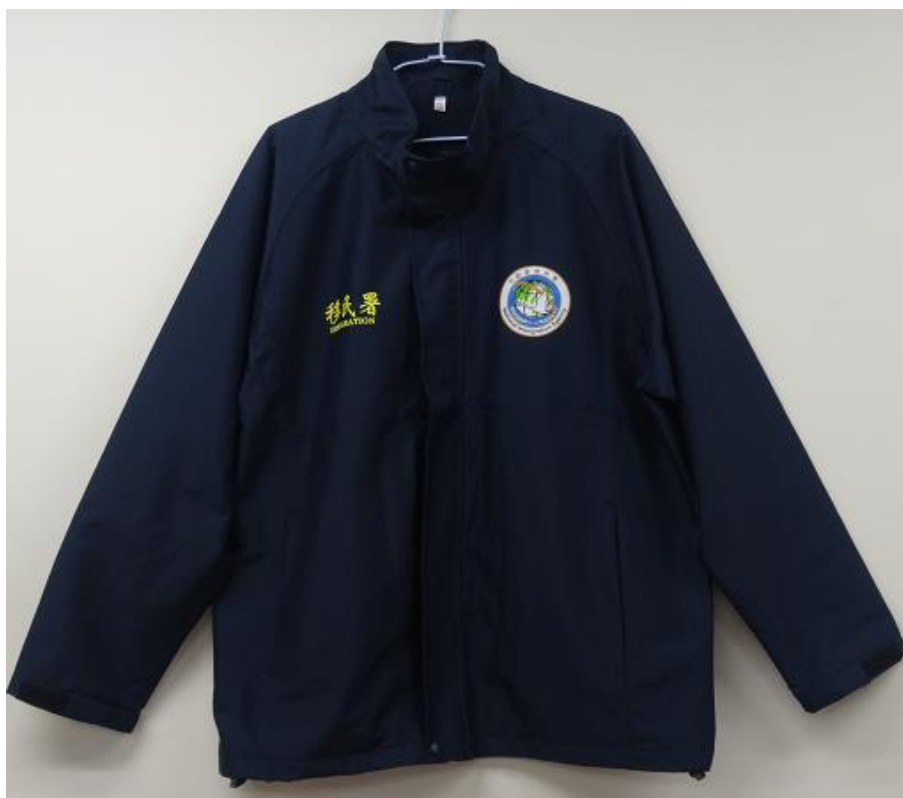
移民署-勤務外套(正面)