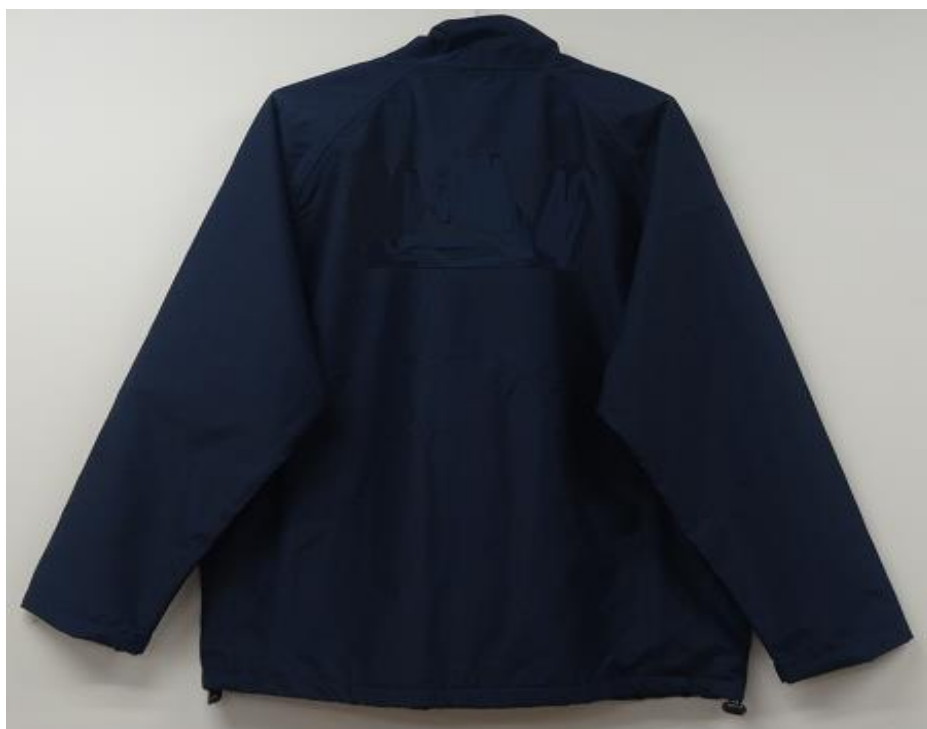
移民署-勤務外套(背面)