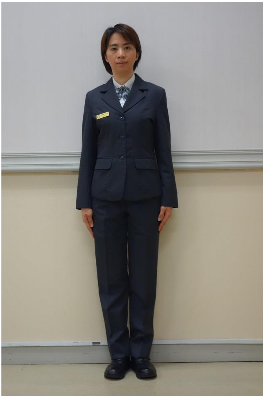
移民署女性便服(正面)