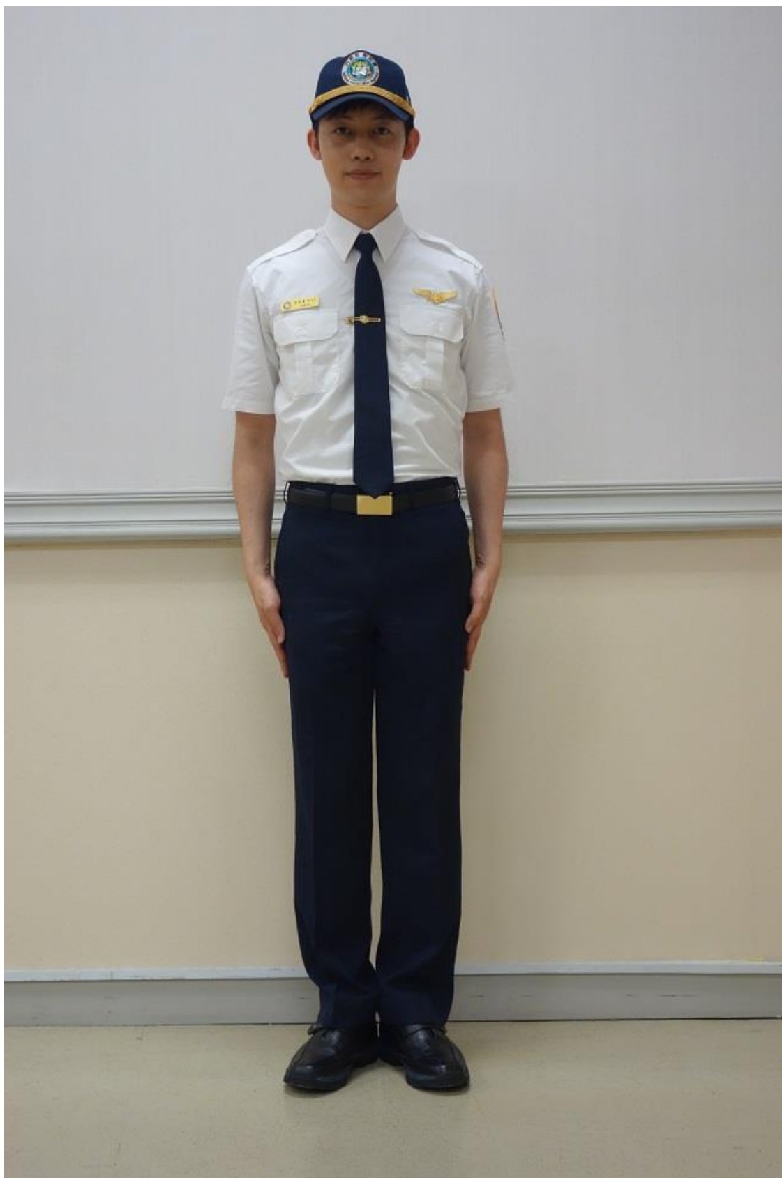
移民署男性夏季常服-襯衫（正面）