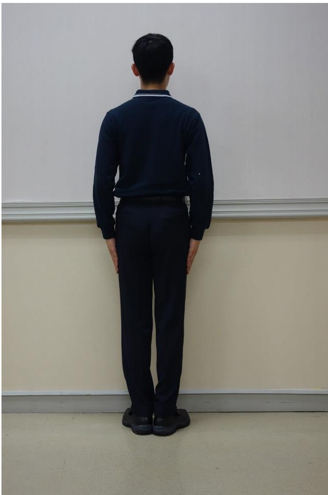
移民署冬季勤務工作服-有領式運動衫(背面)