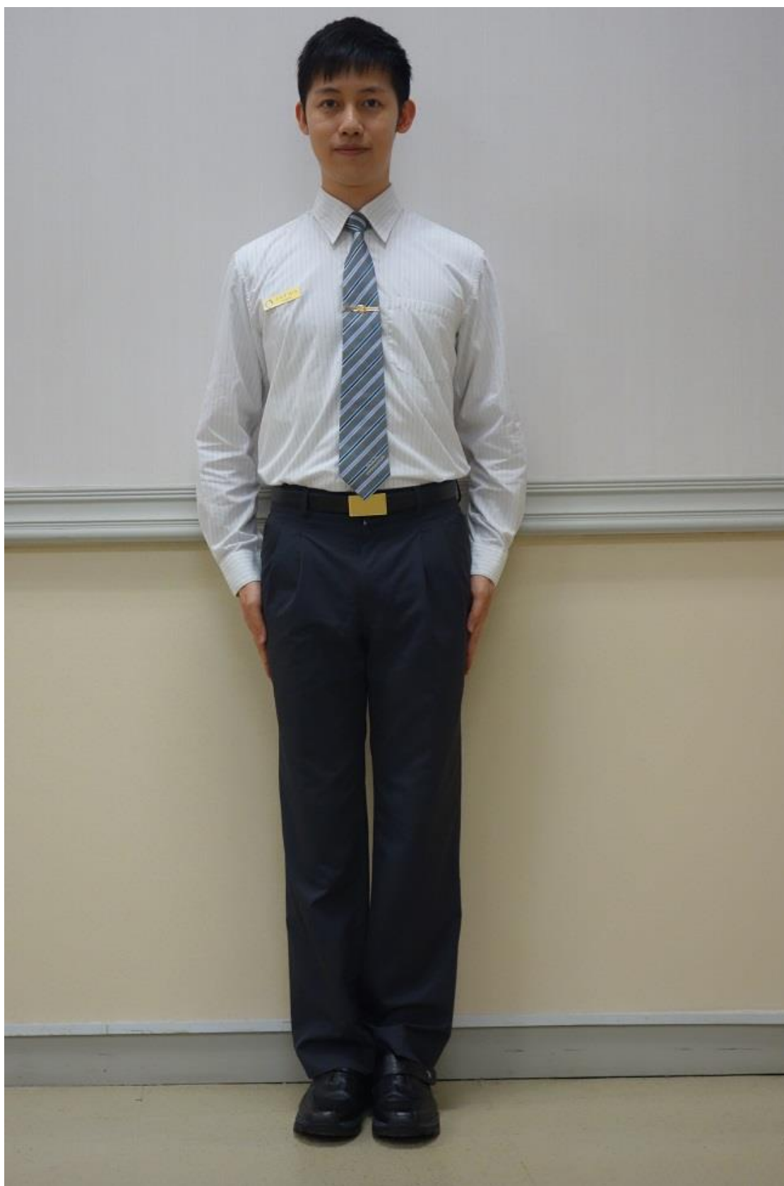
移民署男性冬季便服-襯衫(正面)